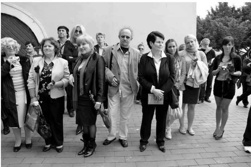
Чланови СКОР-а: из отаџбине и расејања