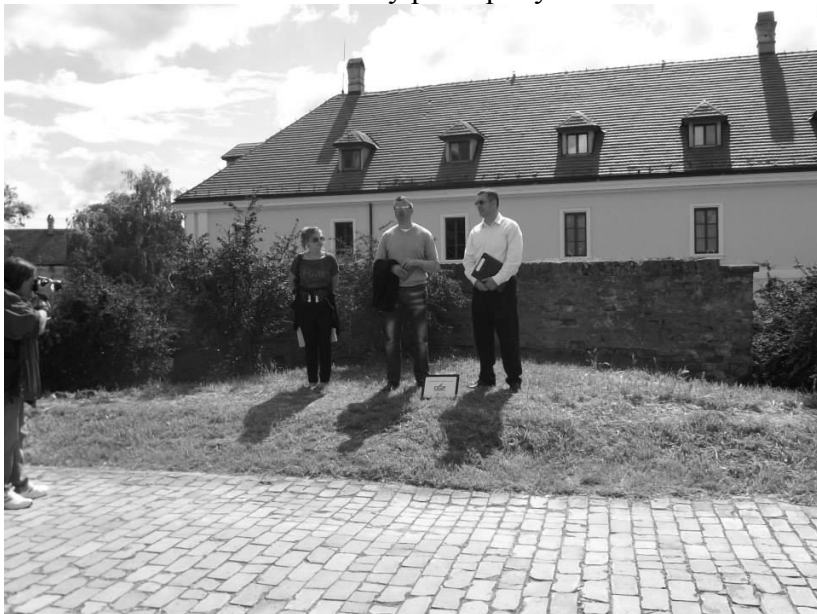
Главни „кривци“ за организацију и реализацију колоније