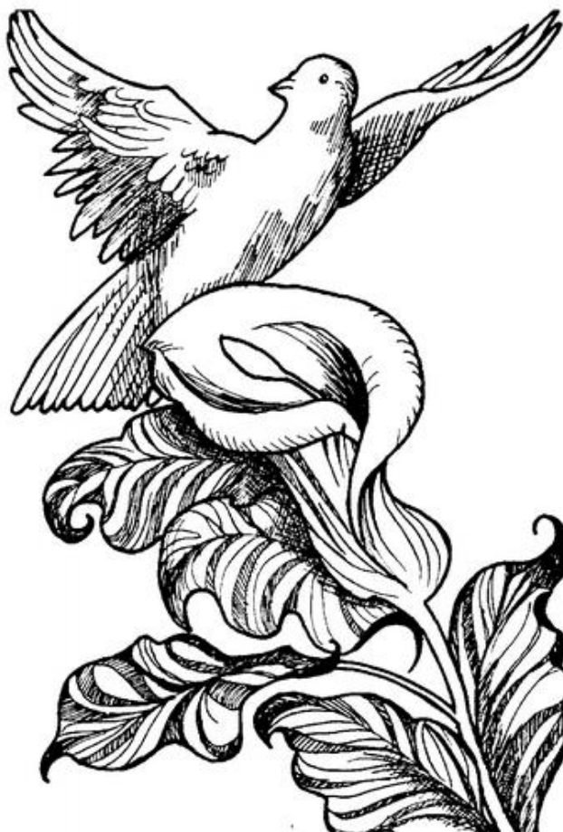
Илустрација: Мирјана Соколовић