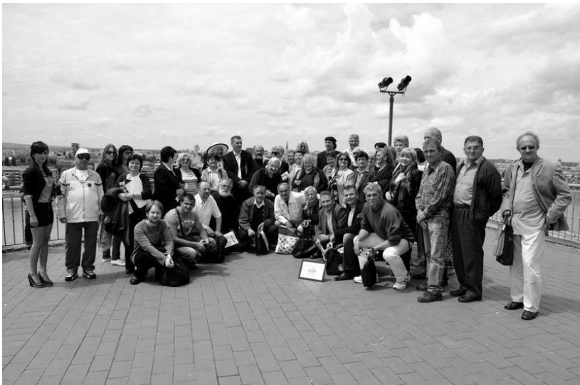
Учесници уметничке колоније „Панонски бисери“