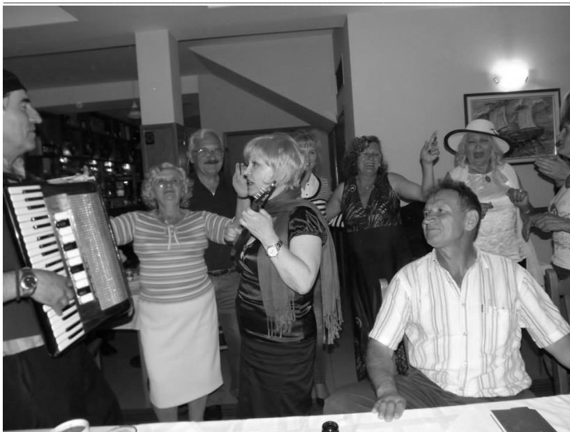
Славље у ресторану