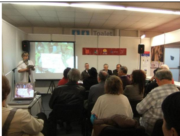
Промоција у Београду, Сајам књига