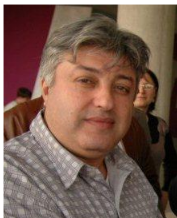
Сабах Ал-Зубеиди, Београд Потпредседник