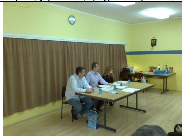
Редовна седница Скупштине, Нови Сад

Фотографије са промоција зборника "Сазвежђа 9" Уметничке колоније "Панонски бисери" и Скупштине