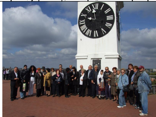
Пета уметничка колонија, петроварадинска тврђава