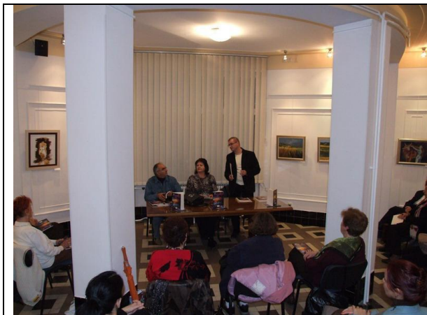
Промоција у Новом Саду, Завод за културу Војводине