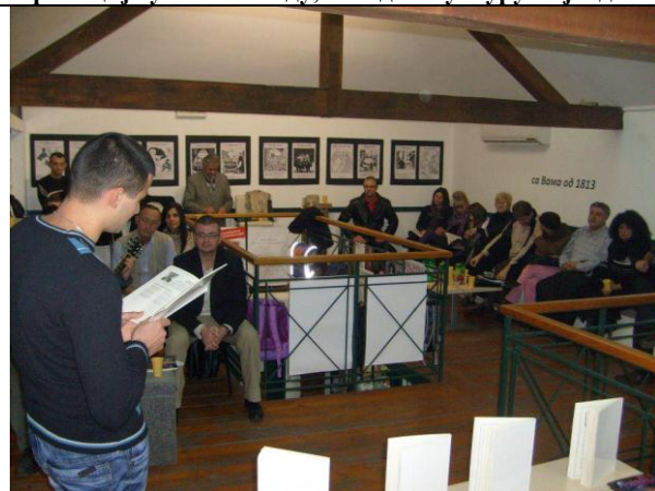
Промоција у Ваљевоу, књижара „Пословни простор“