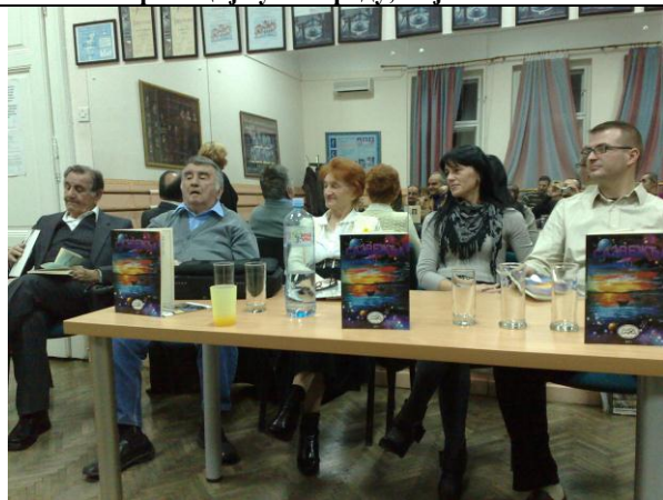
Промоција у Кикинди, Културни центар Кикинда