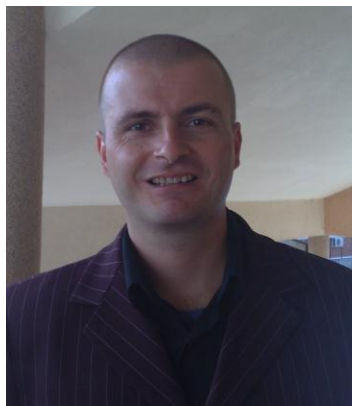
Игор Станковић, Нови Сад председник